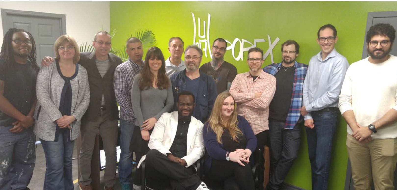
^ Équipe 2017